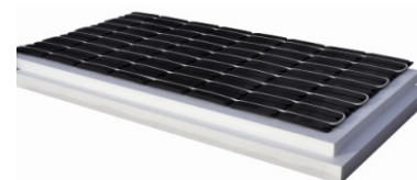
Elektrické podlahové vykurovanie